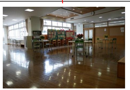
4階 フリースペース