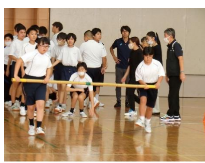
S組 合同運動会練習風景