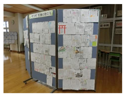
3年 修学旅行 事前学習

そして、3年生は三年間の集大成ともいえる「奈良・京都 修学旅行」に9月9日（月）～11日（水）に出かけます。この学年は1年生、2年生の時は新型コロナウイルス感染症の影響で、宿泊行事も縮小または制限をせざるを得なかった学年でした。3年生になって、やっと制限なく宿泊行事が実施できることもあり、とても楽しみにしている生徒が多いのではないのでしょうか。修学旅行スローガン「最初で最後の私たちの思い出を作ろう」のもと、奈良・京都の素晴らしい歴史的文化的財にふれ心を豊かにするとともに仲間との友情をさらに深める三日間にしましょう。